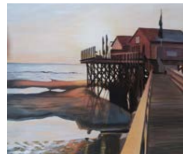
Sonja Arvai Acrylbilder