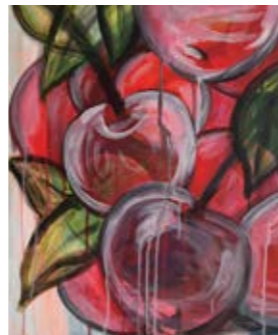
Kartin Könker Öl- und Acrylmalerei